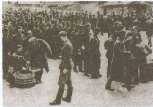
Табір для військовополонених червоноармійців. Сумщина, 1941 р.

У листопаді 1941 р. міністерство постачання Німеччини розглянуло норми харчування військовополонених, згідно з якими було рекомендовано випікати «хліб для росіян», що складався з житніх висівок (50 %) целюлозного борошна (20 %) і перемелених соломи та листя (10 %).