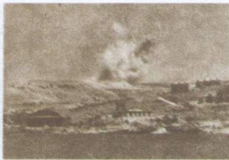
Бій на правому фланзі оборони м. Севастополя (кадр з кінолітопису «Чорноморці»). 1942 р.

Загарбання території України збройними силами Німеччини призвело до її окупації. Окупаційна політика гітлерівців щодо завойованих земель ґрунтувалася на колонізаторських засадах. Нацисти дотримувалися класичного принципу завойовників — «поділяй і володарюй». Плануючи використовувати територію України як життєвий простір для арійської раси, Гітлер поділив її на зони, урахувавши домовленості зі своїми союзниками та поточними потребами ведення війни. Закарпаття ще в 1939 р. було окуповане Угорщиною. Північна Буковина, Ізмаїльщина, райони Вінницької, Одеської і Миколаївської областей, що знаходяться між Дністром і Південним Бугом, утворили румунську провінцію Трансністрія із центром в Одесі. Дистрикт 1 «Галичина» входив до Генерального губернаторства, створеного зі східних територій Польщі. На більшості окупованих територій діяв рейхскомісаріат «Україна» з адміністративним центром у Рівному. Черкаська, Сумська, Харківська та Ворошиловградська області й територія Криму перебували під владою тимчасової військової адміністрації вермахту.