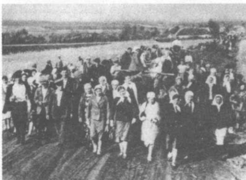
Відправлення українців на примусові роботи до Німеччини. Черкащина. 1942 р.

Провал плану блицкригу, мобілізація працівників промисловості та сільськогосподарства до діючої армії спричинила в Німеччині гострий дефіцит робочої сили. Щоб вирішити цю проблему, гітлерівське керівництво розпочало вербування робітників на окупованих територіях. Так звані служби праці та вербувальної поліції друкували оголошення в газетах, використовували різні пропагандистські засоби, щоб переконати молодих людей у перевагах життя та праці в Німеччині. Проте навіть за найбільшої довіри до цієї пропаганди навесні 1942 р. лише 10 % мешканців окупованих територій завербувалися добровільно, насамперед шукаючи порятунку від голоду. Більшість утікала, усілякими способами ухилялася чи просто не з'являлася на вербувальних пунктах. Тому окупаційні власті, визначивши для міст і сіл певну кількість працездатних людей для вивезення до Німеччини, домагалися виконання поставлених завдань примусовими засобами.