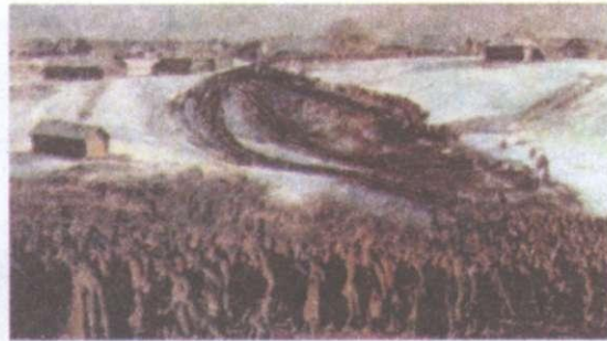
Оточення і розгром радянського угруповання Південно-Західного фронту в районі Лубни–Лохвиця–Кременчук. Вересень 1941 р.

загинув командувач фронту генерал М. Кирпонос і група генералів штабу. В битві за Київ, яка тривала із середини липня до середини вересня 1941 р., вермахт утратив понад 100 тис. бійців.