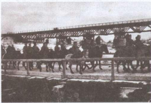
Партизанський загін переходить через р. Случ. Хмельницька обл.

У листопаді–грудні 1942 р. партизанські з'єднання С. Ковпака та О. Сабурова за 30 днів пройшли з боями 750 км теренами Правобережжя.