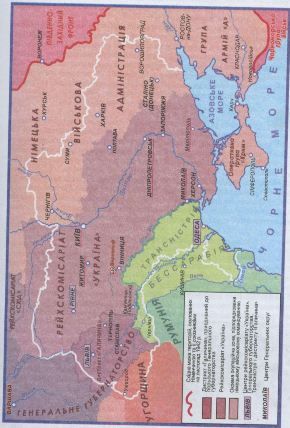
Окупаційний режим в Україні