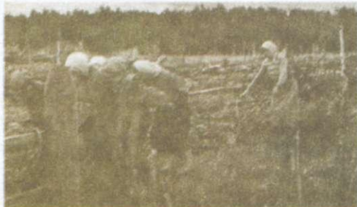
Окупанти використовували селян як тяглову силу для обробітку землі. 1942 р.

У багатьох місцевостях корінним мешканцям заборонялося користуватися залізницею, трамваем, електрострумом, телеграфом, поштою. За умов воєнного часу головним економічним завданням, яке покладалося на окупаційні власті в Україні, було безперервне забезпечення продовольством вермахту та Німеччини. Тому вони зосередилися насамперед