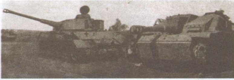
Трофеї радянських військ на Курській дузі. 1943 р.

гармат і мінометів, 3,4 тис. танків і самохідних артилерійських установок, майже 2,7 тис. літаків. У разі ворожого прориву за військами Центрального та Воронезького фронтів, які дислокувалися відповідно на північ і на південь від Курська, стояв резервний Степовий фронт. На випадок переходу противника до оборони він мав якнайшвидше перейти в контрнаступ.