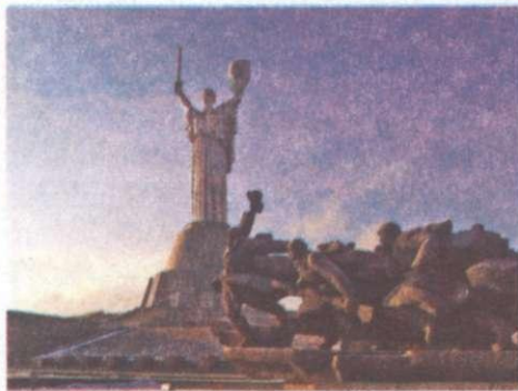
Музей Великої Вітчизняної війни. м. Київ

• Чим розпочалася для вашого краю війна з гітлерівцями? • Чи зачепила його мешканців мобілізація та евакуація військово-господарських ресурсів? • Де проживали і чим