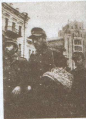
Німецькі військовополонені в Києві. 1944 р.