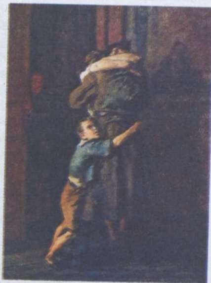
В. Костецький. Повернення. Травень 1945–1947 рр.

Протягом 1941–1944 рр. на території України зосереджувалося від 56 до 76 % загальної кількості дивізій вермахту. Тут було проведено майже половину стратегічних операцій Червоної армії. У боях проти нацистської Німеччини та милітаристської Японії воювало понад 7 млн українців. Кожний другий із них загинув у боях, половина учасників бойових дій повернулася додому інвалідами.