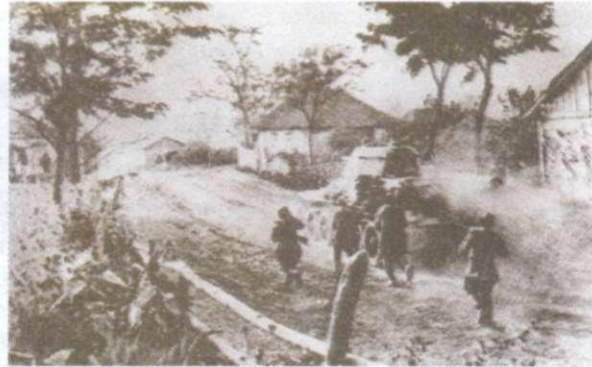
Наступ радянських військ на Харків. 1943 р.

першим на території України було звільнено село Півнівка та інші села Міловського району Ворошиловградської (тепер Луганської) області.