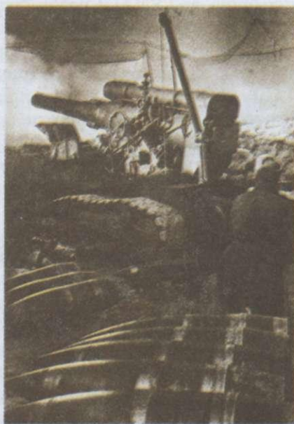
Корсунь-Шевченківська битва. 1944 р.

Успішні операції Червоної армії, як правило, завершувалися оточенням військ противника. Вирватися з нього в гітлерівців не вистачало сил. Секретом таких успіхів були особливості радянських проривів фронту. Вони майже завжди здійснювалися силами стрілецьких піхотних дивізій, а потім у бій вступали механізовані частини. Вермахт здійснював свої прориви силами танкових дивізій, за якими в бій йшли піхотні дивізії. Радянський спосіб проривів забезпечував