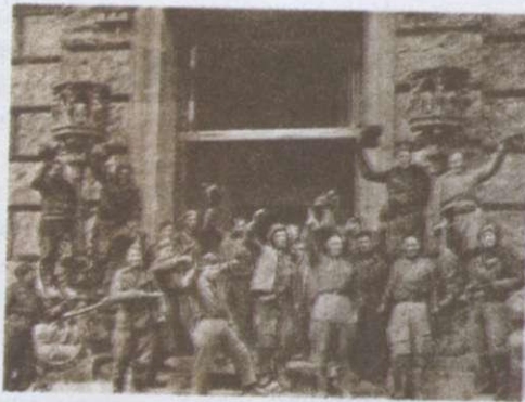
Переможці біля рейхстагу. Травень 1945 р.

Український народ зробив значний внесок у завершення Другої світової війни, узявши участь у розгромі японського милітаризму на Далекому Сході, звільненні Маньчжурії та Кореї. 2 вересня 1945 р. Акт капітуляції Японії від імені СРСР підписав уродженець Черкащини генерал Кузьма Дерев'яко — єдиний із радянського генералітету, хто знав англійську та японську мови, як того вимагав дипломатичний протокол.