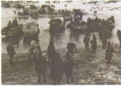
Бійці 1-го Українського фронту форсують р. Тетерів. Житомирщина. 1944 р.