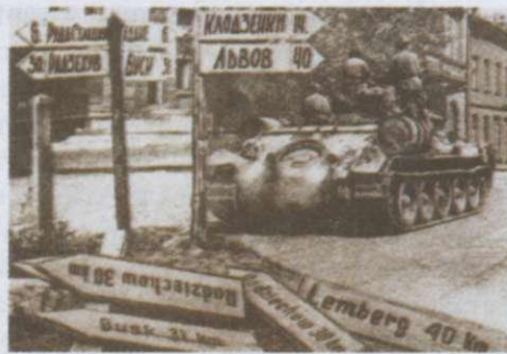
Радянські війська на Львівщині. 1944 р. 61

Битву за Карпати нацисти вели з відчайдушною впертістю. Вони усвідомлювали, що це один з останніх природних рубежів, що прикривав територію Третього рейху з півдня. Шлях радянським військам перекрили 19 дивізій. Трохи пізніше німецьке командування перекинуло