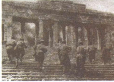
Бій за звільнення м. Севастополя. 1944 р.

повне опанування місцевості та надійне утримання оточених, однак супроводжувався великими втратами живої сили. У середньому в ході активних бойових дій червоноармієць перебував у строю до поранення або загибелі всього 8 днів.