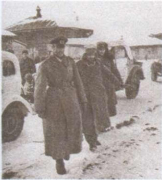
Ф. фон Паулюс здається в полон. 1943 р.