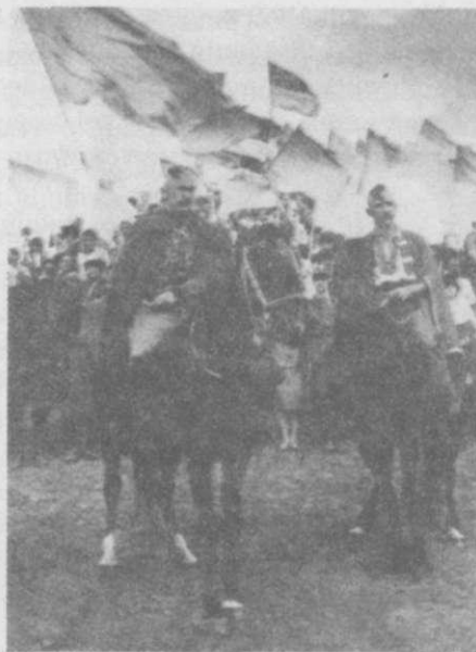
Студенти Вінницького педагогічного інституту на святкуванні 500-річчя українського козацтва

3–5 серпня на місці колишньої Запорозької Січі відбулися Дні козацької слави. Особливо масовими вони були в с. Капулівці Дніпропетровської області біля могили отамана Івана Сірка, де колись знаходилася Чортотлицька Січ. Свято було уквітчане національними прапорами. Тоді ж відбулися заходи на о. Хортиця.