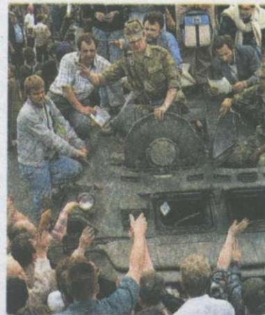
Спроба державного перевороту в СРСР.