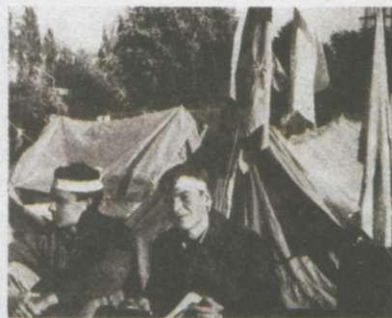
Голодування студентів у Києві. 1990 р.

Під тиском громадськості влада змушена була надати студентам можливість виступити в прямому телеєфірі на УТ-1. Вони закликали до Всеукраїнського страйку. Студенти передали свої вимоги до Верховної Ради, яка створила погоджувальну комісію для їхнього розгляду. 17 жовтня Верховна Рада прийняла постанову «Про розгляд вимог студентів, які проводять голодування в м. Києві з 2 жовтня 1990 року». Влада змушена була задовольнити вимоги студентів. Студентська суспільно-політична активність мала важливе значення для проголошення незалежності України.