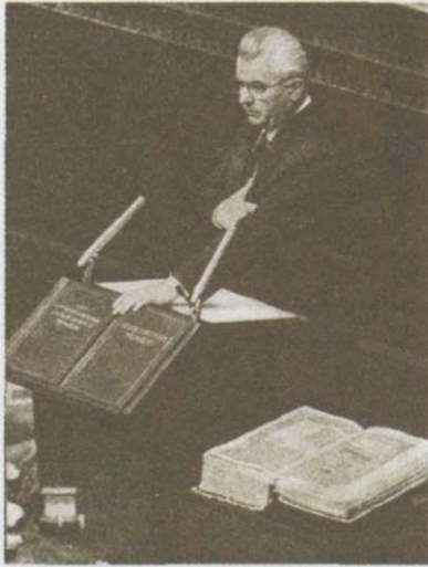
Леонід Кравчук складає присягу Президента України

Одночасно з референдумом відбулися вибори Президента України. Кандидатів на цю посаду висунули партії, рухи, трудові колективи. Центральна виборча комісія зареєструвала сім кандидатів, серед яких найвідомішими були: голова Верховної Ради України Л. Кравчук, голова Львівської обласної ради В. Чорновіл, голова Української республіканської партії Л. Лук'яненко. Незважаючи на відмінності програм, усі кандидати заявляли, що вони виступають за незалежність України.