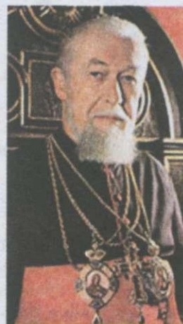
Кардинал Мирослав Любачівський

У травні 1989 р. делегація УГКЦ прибула до Москви зі зверненням до М. Горбачова про відновлення церкви. Однак вона не отримала позитивної відповіді, через що на знак протесту група греко-католиків розпочала голодування в центрі міста. Одночасно відбувалися багатотисячні мітинги та демонстрації. Глава УГКЦ кардинал М. Любачівський звернувся до віруючих із закликом стати на захист релігійної свободи, на який відгукнулися тисячі віруючих. Вони взяли участь у церковних службах по всій Західній Україні.