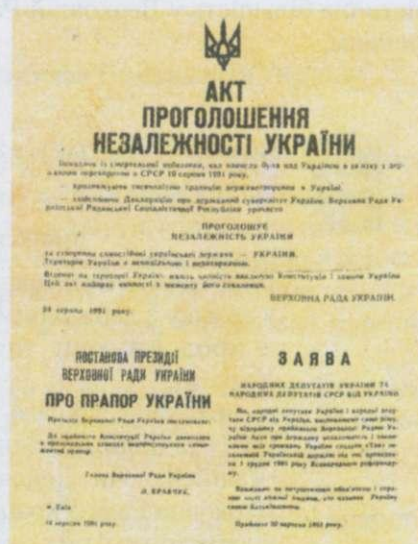
Акт проголошення незалежності України

Після поразки заколотників, які намагалися здійснити державний переворот, склалися сприятливі умови для здобуття Україною незалежності. 24 серпня 1991 р. була скликана позачергова сесія Верховної Ради УРСР, яка прийняла документ виняткової історичної ваги — Акт проголошення незалежності України . За проголошення незалежності проголосували 346 народних депутатів, проти — 4. Під впливом поразки заколотників за акт проголосувала також значна частина депутатів-комуністів. Результати голосування депутати зустріли бурхливими оплесками, у залі панував урочистий і піднесений настрій. З прийняттям цього доленосного документа Українська Радянська Соціалістична Республіка перестала існувати. У світі з'явилася нова держава — Україна.