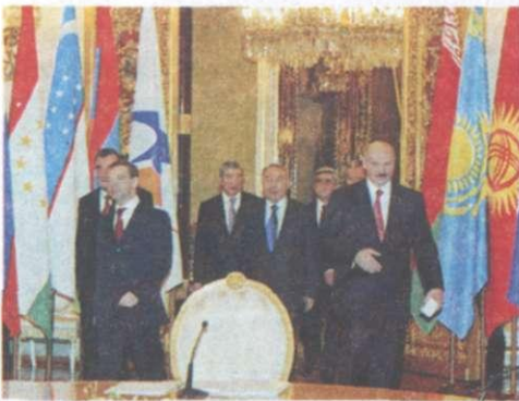
Саміт глав держав-учасниць СНД. Вересень 2008 р.

Одним із завдань СНД Україна вважає розвиток відносин такої якості, які б дали можливість усім країнам Співдружності якомога швидше інтегруватися у світовий економічний простір. Українське державне керівництво не допустило, щоб така міжнародна організація, як СНД, перетворилася на воєнно-політичний блок чи послужила створенню нового різновиду Радянського Союзу. З огляду на існування таких прагнень, українське керівництво не підписало статут СНД. Через це Україна має юридичний статус асоційованого члена СНД, але