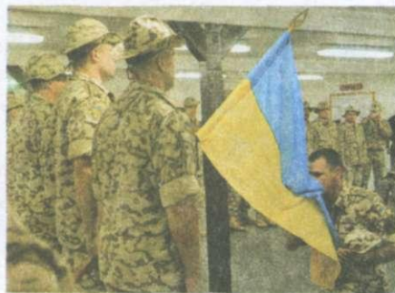
Українські миротворці в Судані

Україна, як держава-засновниця, активно співпрацює з ООН. Наша держава є членом Економічної та Соціальної Ради ООН, Координаційної ради керівників ООН, Комісії