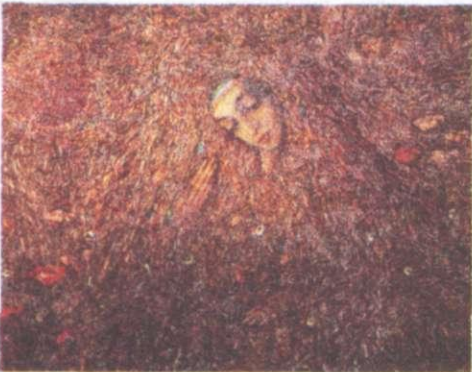
І. Марчук. Пробудження. 1992 р.

• Які зміни відбулися в промисловості, аграрній сфері краю, соціальному становищі населення? • Як відбувалося роздержавлення й приватизація, як пристосувалося населення до вимог ринкової економіки? • Куди спрямовувалися еміграційні потоки з вашого краю?