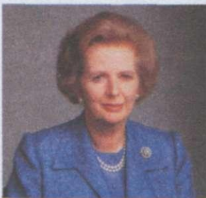
84 Маргарет Тетчер

Отже, програма передбачала докорінні зміни в соціально-економічній політиці уряду.