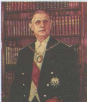
Шарль де Голль

Нова конституція Франції ( конституція П'ятої республіки ), прийнята 28 вересня 1958 р. , значно звузила повноваження парламенту та розширила права президента. Президент обирався на 7 років не на засіданні парламенту, як раніше, а колегією з 80 тис. виборців. Він наділявся повноваженнями глави держави, голови виконавчої влади та головнокомандувача збройних сил, мав право розпускати Національні збори, затверджувати закони, ухвалені парламентом, але міг видавати й власні декрети. 21 грудня 1958 р. кандидатуру Шарля де Голля на посаду президента Франції підтримали 75,5 % виборців.