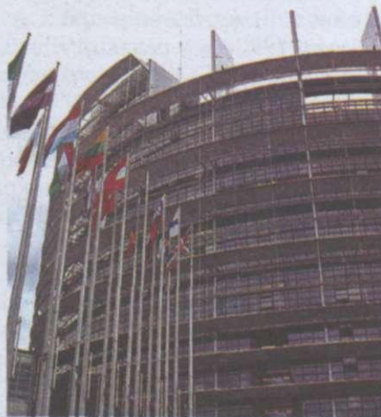
Будинок Європарламенту в м. Брюсселі. Бельгія

Маастрихтський договір – один із найважливіших правових актів в історії ХХ ст., є логічним продовженням понад 40-річної історії євроінтеграції. На початку ХХІ ст. Європейський Союз значно розширив свій склад. У 2004 р. членами цієї міжнародної організації стали ще 10 країн: Польща, Чехія, Угорщина, Кіпр, Латвія, Литва, Естонія, Мальта, Словаччина, Словенія, а в 2007 р. до ЄС приєдналися Болгарія та Румунія.