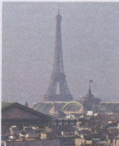
Ейфелева вежа — символ столиці Франції

За період існування Четвертої республіки змінилося 25 кабінетів. Правляча верхівка країни намагалася запобігти остаточному розпадові імперії. Тому, коли під керівництвом Фронту національного визволення (ФНВ) Алжиру в цій країні