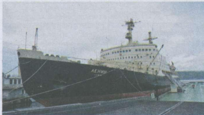
Перший у світі атомний криголам «Ленін»