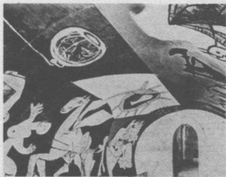
П. Пікассо. Розпис храму Миру у Валлорисі. 1952 р.

Найвідоміший французький художник, іспанець за походженням Пабло Пікассо, з ім'ям якого пов'язана ціла епоха в живописному мистецтві, активно працював і в повоєнні роки. У його творчості переважали ідеї любові до життя й