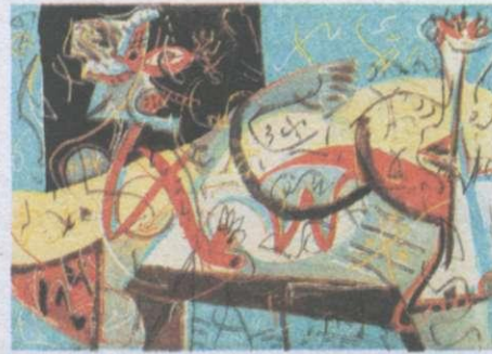
Дж. Поллок. Стенографісти. 1942 р.

Течію повоєнного абстракціонізму можна поділити на три великі групи. Перша з них — абстрактний експресіонізм, засновником якого став американець Джексон Поллок . Він запропонував термін «дрипінг» — розбризкування фарб на полотні без використання пензля, за допомогою інших предметів. У цьому мистецтві акцентується дія, процес створення картини. Інший представник цього напрямку, Жорж Мат'є , супроводжував свої творчі сеанси маскарадними перевдяганнями та музикою.