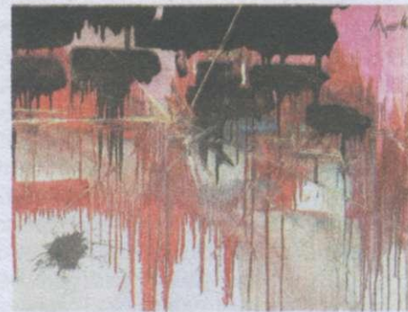
Ж. Мат'є. Присрасне презирство. 1990 р.

Третю групу становлять послідовники технізованого, абстрактно-геометричного мистецтва. Живописці створюють строго геометричні декоративні композиції, скульптори використовують для своїх абстрактних творів полірований або грубий зварний метал, а також металеві механізми та пристосування.