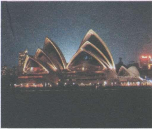
Сіднейська опера (Австралія). Архітектор Й. Утцон