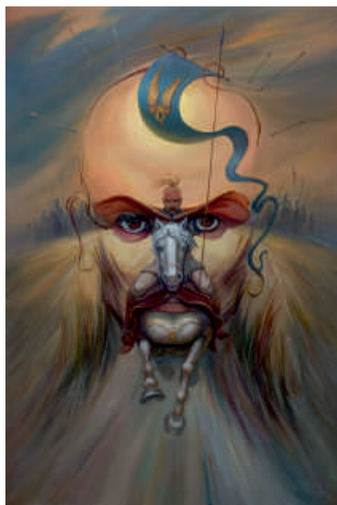
Олег Шупляк. «Іду на Ви!» Святослав Хоробрий (репродукція)