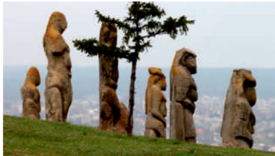
Кам'яні баби на острові Хортиця