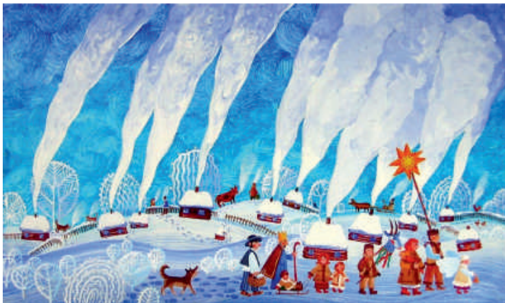
Ольга Кваша. Колядки (репродукція)