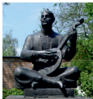
Пам'ятник козакові Мамаю в Переяславі- Хмельницькому