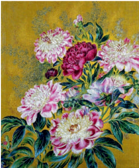
Катерина Білокур. Півонії (репродукція)

Три картини Білокур — «Цар-Колос», «Берізка» і «Кол-госпне поле» демонстрували на Міжнародній виставці в Парижі (1954), де їх побачив і високо оцінив Пабло Пікассо. Ці твори принесли їй світову славу. В останні роки життя художниця створила чудові картини «Півонії», «Букет квітів», «Квіти і овочі», «Натюрморт».