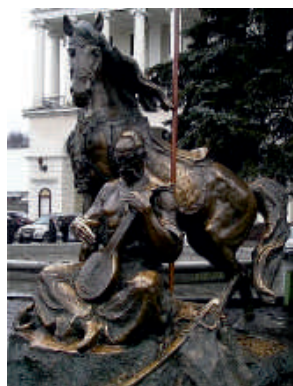
Пам'ятник козакові Мамаю в Києві

Здавалось би — дозвілля і розвага, та варто придивитися пильніше: у вправах цих по літерці звитяга майбутніх перемог літопис пише.