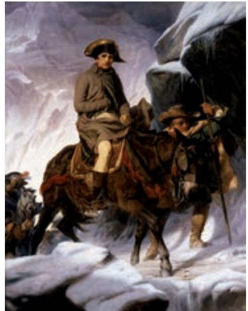
▲ Поль Деларош. Бонапарт переходить через Альпи, 1848

Наполеон Бонапарт (1769–1821) був для романтиків улюбленим героєм: доля піднесла його на непомірну висоту, а відтак жорстоко кинула в безодню. Він переміг у багатьох битвах, завоював народи, заснував імперію, а потім зазнав поразки і скінчив життя у вигнанні.