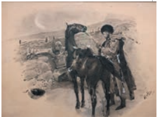
▲ Михайло Врубель. Казбич і Азамат, 1891

Максим Максимович звик до Бели, як до дочки. Печорін убивав її, як лялечку,