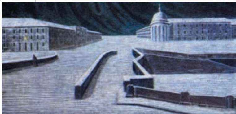
◀ Савва Бродський. У холодних просторах Петербурга

Небо – пола шинелі, крижаний, геометрично правильний міський пейзаж – і самотня маленька людина, загублена у ворожому просторі.