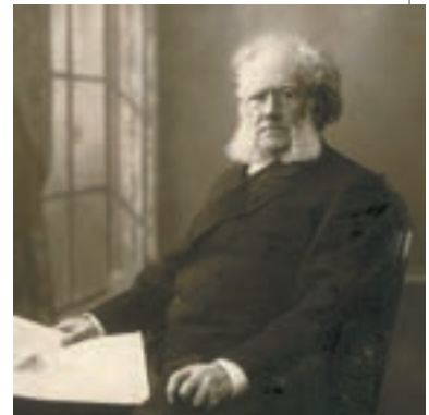
▲ Генрік Ібсен

Після переїзду до Христіанії (тепер Осло) Ібсен з головою поринув у суспільно-політичне життя. Його перша п'єса «Катиліна» була відхилена і театром, і видавцями. Тоді письменник видав її