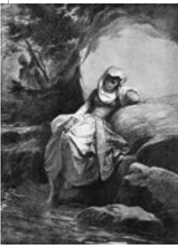
▲ Михай Зічі. Бела, 1902