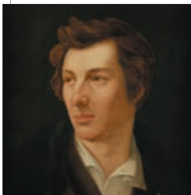
▲ Готліб Гессен. Портрет Гайне, 1828

Чудову пісню – пісню нову, О друзі, я буду співати! Ми хочемо царство небесне тут, На цій землі, збудувати.