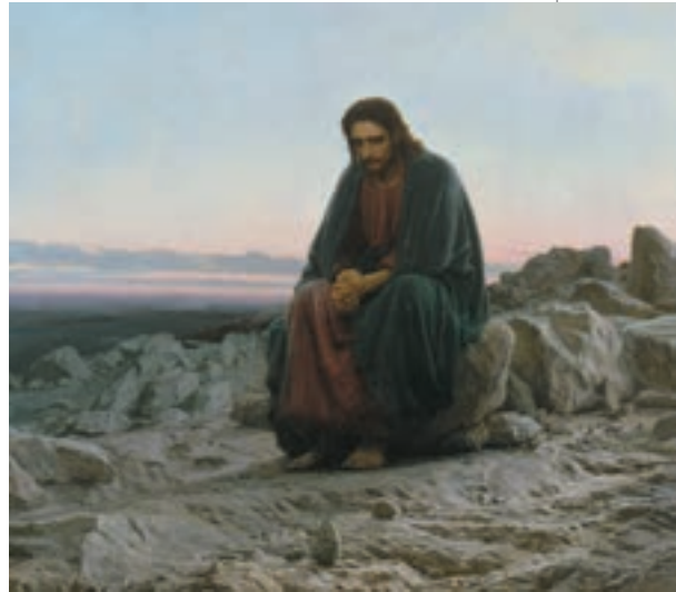
▲ Іван Крамської. Христос у пустелі, 1872

Навколо все піднесене: і пустеля, що вслухається в Божественну істину і є місцем усамітненої зустрічі із Всесвітом, і зорі, що зійшлися, наче сусідки надвечір, щоб, позбувшись денних турбот, погемоніти про, можливо незначні, але такі важливі для них речі. Довколишня природа об'єднана в живий неподільний організм, з якого випадає ліричний герой. З одного боку, йому відкрита краса й одухотвореність Всесвіту. Ліричний герой може спостерігати «прекрасні та безкраї» небеса, прислухатися до гомону зірок і почути слова Бога. Але куди веде його, самотнього, «крем'яна в тумані путь»? Що погнало його в дорогу