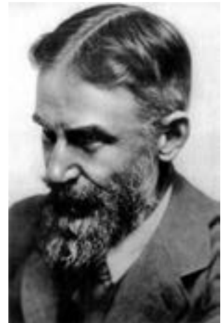
▲ Бернард Шоу

Бурхлива натура Шоу не задовольнялася очікуванням письменницької слави, а вимагала активної дії. У 1880-х рр. він поринув у громадсько-політичну діяльність, ставши вуличним промовцем. Згодом драматург згадував вулиці, переповнені людьми під час його виступів. Оратор міг би заробляти великі гроші, та грошей не брав, бо своїми політичними поглядами не торгував.