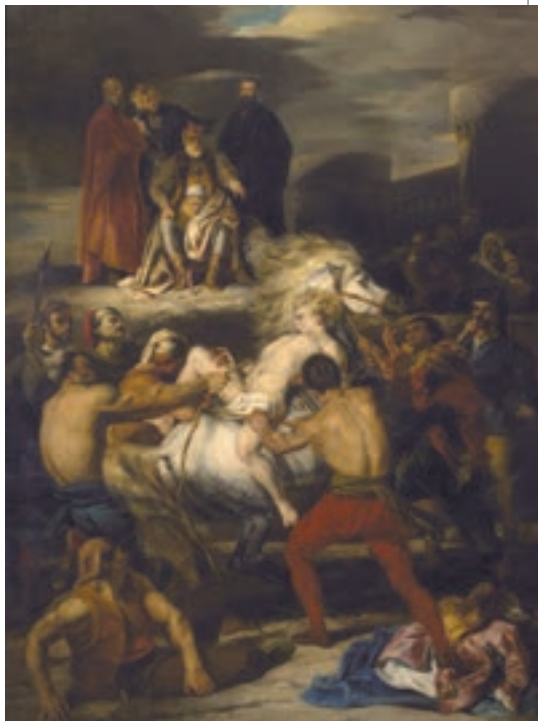
▲ Луї Буланже. Страждання Мазепи, 1827

Як дощ, на гриву, на живіт Мого коня, який весь час Щетиною в нестямі тряс, Від страху пирскав, горбив спину І мчав галопом без ушину. Я іноді хотів, щоб він Сповільнив трохи свій розгін, Ба ні – від зв'язаного тіла В нім наростала гнівна сила І ще прискорювала біг, І кожний рух, який я міг Зробити, щоб мій біль пом'як, Будив у ньому переляк. Я випробував голос мій – Він був і тихий, і слабкий, Але і цей найменший видих Конем сприймався, ніби вибух, Немов лунав мисливський ріг, І він стрибав, і швидко біг. Тим часом гострі ланцюги Врізались більше від ваги, Кривавим потом промокрілі, Який стікав по всьому тілі, А спрага пра́жила язик, Вогонь – і той би так не пік!