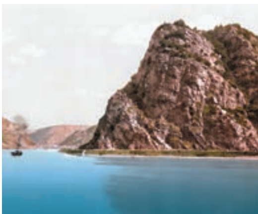
▲ Скеля Лор Лей на Рейні

Історію про дівчину, яка всіх, хто пливе Рейном біля скелі Лор Лей, зачаровує своїм співом, розповів у баладі німецький поет-романтик Клеменс Брентано.