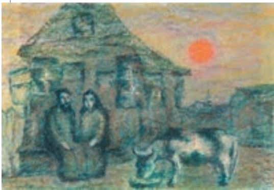
▲ Анатолій Каплан. Тев'є і Голда, 1976

От ви кажете: теперішні діти. « Синів ростив я і виховував... » – народжуй їх, поневіряйся, віддавай їм усі сили, працею, як віл, день і ніч, і чого, скажіть, будь ласка? Думаєш собі, може так, а може так, кожен згідно з своїм розумом і достатком. Чому, питаєте? По-перше, мене Господь благословив вродливими дочками.