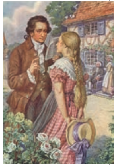
▲ Гете і Фредеріка. Поштівка, Німеччина, кінець XIX ст.

Фредеріка назавжди зберегла в серці кохання до поета і так і не вийшла заміж. А спомини про неї надихнули Гете на створення образу Маргарити у філософській трагедії «Фауст».