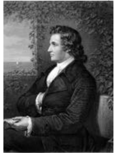
▲ Й. В. Гете. Гравюра за портретом Г. М. Крауса, після 1775

У Страсбурзі Гете познайомився з німецьким філософом і письменником Й. Г. Гердером. Він очолював гурток, членів якого називали штюрмерами, «буремними геніями» (від назви драми Ф. Клінгера «Sturm und Drang» («Буря і натиск»)). Як буря вносить свіжий струмінь у затхле повітря, так і штюрмери вносили свіжий вітер буремних почуттів у затхлу атмосферу тогочасної німецької літератури. Вони виступали за об'єднання безлічі тогочасних німецьких земель в єдину могутню країну, цікавилися національною самобутністю літератури, фолькло-