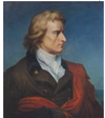
▲ Герхард фон Кюгельген. Фрідріх Шиллер, 1808–1809

Можливо, саме тогочасна муштра і залізна дисципліна посяли в душі юнака зерна вільнолюбства. Уже перша його трагедія «Розбійники» перетворилася на заклик до боротьби з тиранією. А що це таке, Шиллер знав з власного досвіду: герцог не лише заборонив письменнику бувати на виставах його власної п'єси, а й займатися літературою. І письменник, чіями віршами і п'єсами захоплювалася вся мисляча Європа, мусив таємно тікати, щоб знайти прихисток у сусідніх «клапчикових» державах. А це було непросто.