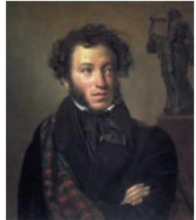
▲ Орест Кипренський. Олександр Пушкін, 1827

З мовчазного вайлуватого хлопчика, якого матір частенько лаяла за незграбність, він перетворився на стрункого ліцеїста. Юнак міг з місця перестрибнути кілька стільців, згодом став вправним вершником і фехтувальником, купався в крижаній воді, влучно стріляв (був завзятим дуелянтом), грався важкою палицею як тростинкою, щодня долаючи пішки з десятків верст, і був, попри маленький зріст і далекі від ідеалу риси обличчя, улюбленцем жінок.