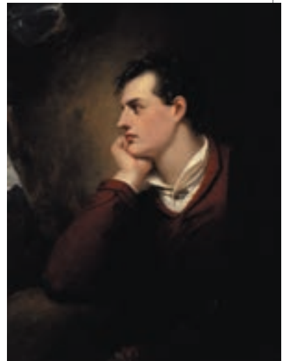
▲ Річард Вестолл. Джордж Гордон Байрон

Вже в Гарроу Байрон показав силу своєї натури. Від неправильного лікування дитячої хвороби одна нога в нього була трохи коротшою за іншу, і він ходив, трохи накульгуючи. Але характер мав залізний, багато й напружено займався спортом і ціною неймовірних зусиль і виснажливих тренувань він навчився ходити не кульгаючи, та ще й став чудовим фехтувальником, боксером, гравцем у крикет і одним із найкращих танцюристів Лондона. А ще Байрон був чудовим плавцем: у 1809 р. він уплав подолав гирло ріки Тахо (це