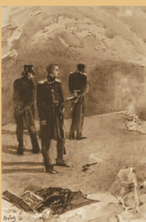
▲ Михайло Врубель. Дуель Печоріна з Грушницьким, 1891