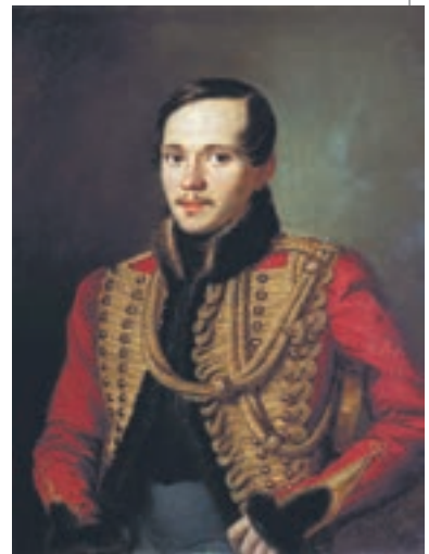
▲ Петро Заболотський. Михайло Лермонтов, 1837

Зятя свого, відставного капітана, красеня без серйозного статку, вона не любила. Зовсім не таким вона хотіла бачити чоловіка для своєї улюбленої доньки Марії, але все-таки дозволила їй одружитися «з любові». І ось через три роки після народження Мішеля (так його називала бабуся) слабка на здоров'я донька почала хворіти й незабаром пішла з життя. Єлизавета Олексіївна звинуватила в цьому зятя, і відтоді хлопчик ріс без спілкування з батьком. Доходило до того, що ледь на дорозі, яка вела до Тархан, здіймалася курява від екіпажу Юрія Петровича, який хотів побачити сина, за суворим наказом Єлизавети Олексіївни Михайла (як був, а якщо спав – загорнутого в ковдру) відвозили геть із Тархан, щоб той не побачив батька. Згодом поет гірко згадуватиме печальну долю самотніх, розлучених життям батька й сина.