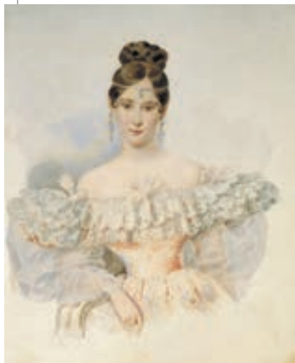
▲ Олександр Брюллов. Наталія Гончарова, 1831–1832