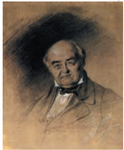
▲ Тарас Шевченко. Михайло Щепкін, 1858

Хоча державні службовці всіх рангів у комедії сприймаються як єдиний організм (всі вони користолобні, впевнені в безкарності й правильності своїх дій), але кожен персонаж веде свою партію. Головним, звичайно ж, є городничий. Антон Антонович Сквозник-Дмухановський (прізвища персонажів є прозивними) «служить» уже тридцять років. Як людина кмітлива, він не упускає вигоди, що сама «пливе до рук». Але в місті повний безлад: вулиці брудні, арештантів і хворих годують погано, поліцейські вічно п'яні і розпускають руки. Городничий тягає за бороди купців і щоб отримати більше хабарів, святкує іменини двічі на рік. Гроші, відпущені на будівництво церкви, зникли. Суддя Ляпкін-Тяпкін є зятим мисливцем, тож бере хабарі хортенятами, щиро вважаючи, що це «зовсім інша справа», ніж грошима. Поштмейстер щиро дивується, чому це не можна читати чужі листи. Адже для нього все життя є цікавими сюжетами з листів. Особливо цікаві коре-