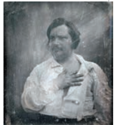
▲ Оноре де Бальзак. Фото, 1842

І взагалі батькові Бальзак зобов'язаний багато чим. Той був вульгарним матеріалістом і залишив низку творів із соціальних питань; над усе він ставив завдання фізичного поліпшення людської природи й за допомогою природознавства мріяв вирішити соціальні й моральні питання свого часу. Оноре успадкував його світогляд, здоров'я й залізну волю. Бальзак є яскравим типом письменника, що розвивався під впливом великих успіхів природознавства, серед суворої боротьби й жорстокої конкуренції, викликаній ростом промисловості. Його творчість пронизана прагненням перенести методи природознавства в художню літературу, стерти грань, що відокремлює літературу від науки.