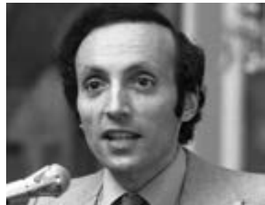
▲ Ерік Сігел

Книжка «Історія одного кохання» стала бестселером в США і була перекладена 33 мовами (в тому числі українською – переклад був опублікований