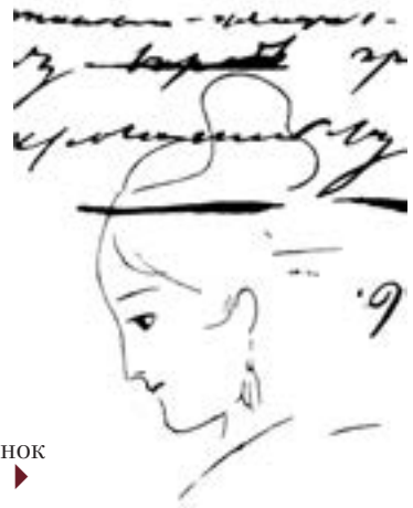
Анна Керн. Малюнок О. Пушкіна

▼ Алея Анни Керн в маєтку Пушкіних в селі Михайлівському