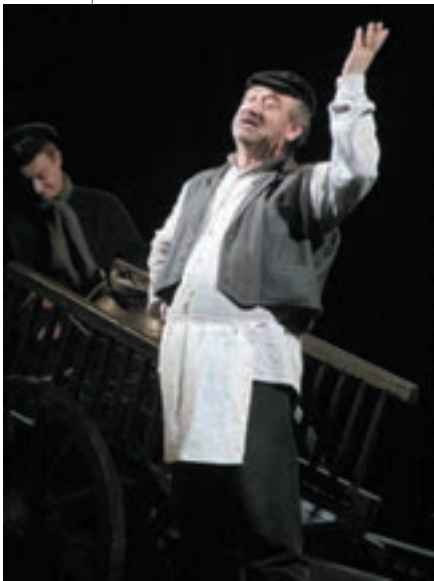
▲ Богдан Ступка у ролі Тев'є-Тевеля