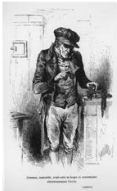
▲ Шарль Тамізьє. Гобсек, 1832

1 Метсю Габріель (бл. 1630–1667) – нідерландський художник.