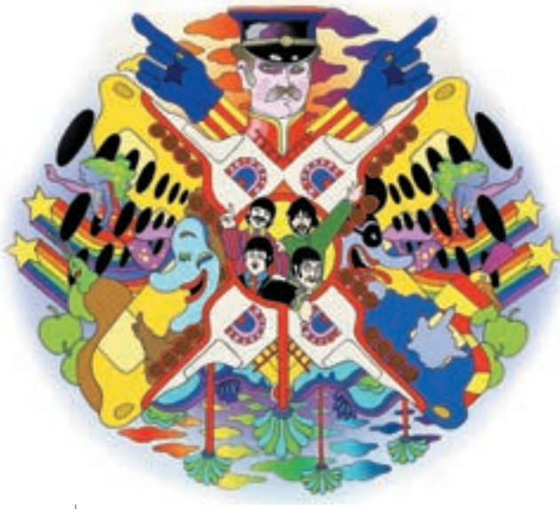
◀ Кадр з анімаційного шедедру Yellow Submarine

у журналі «Всесвіт»), а її наклад сягнув 21 000 000 примірників (за опитуваннями, тоді її прочитав кожний п'ятий американець!). А стрічка, яку таки зняли, стала лідером прокату 1971 р.