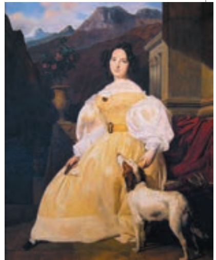
▲ Фердинанд Георг Вальдмюллер. Евеліна Ганська, 1835

28 лютого 1832 р. в житті письменника відбулася знаменна подія. Він отримав з Одеси листа, написаного красивим жіночим почерком з інтригуючим